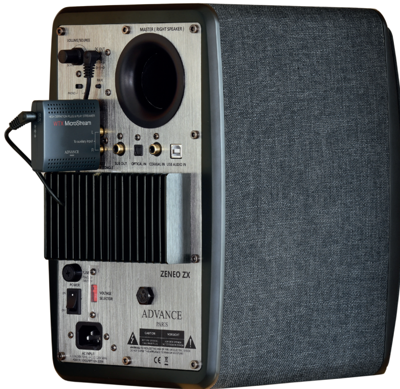
ZENEO ZX équipé du plug-in réseau WTX ZENEO ZX with WTX WIFI dongle

Les boomers sont équipés d'une membrane en papier traité avec surfaçage rigidifiant afin d'obtenir un son neutre et vivant. Les bobines mobiles en cuivre pur sont câblées sur support capton. Pour éviter toute agressivité et améliorer la douceur, les tweeters ont des membranes en tissu imprégné et les bobines mobiles sont refroidies dans du ferrofluide.